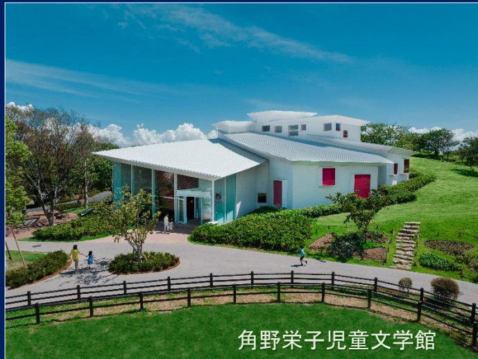
角野栄子児童文学館