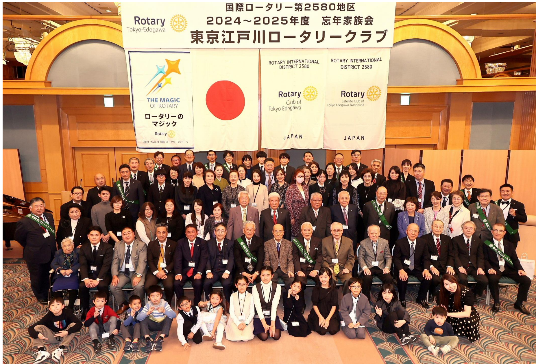
忘年家族会 2024年12月21日(土)ホテルイースト21東京「永代の間」